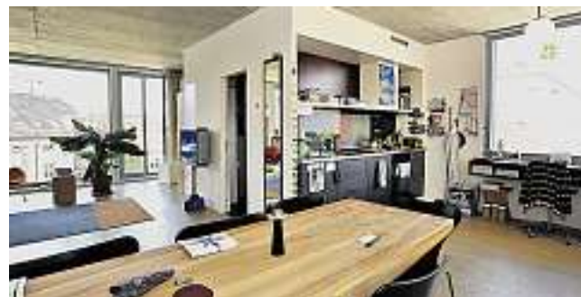
Eine offene Raum-Einteilung lässt den Bewohnerinnen und Bewohnern viel Freiheit beim Einrichten.