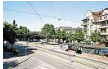
Der Breitenrainplatz heute ...

Der unwirtliche Breitenrainplatz in Bern soll schöner werden. Und allen Nutzerinnen und Nutzern gleiche Rechte bieten.