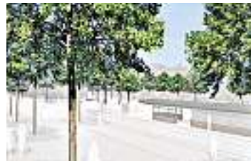
... und wie er werden soll.

Der Breitenrainplatz im Nordquartier von Bern lädt nicht zum Verweilen ein. Tausende Autos und Laster und Hunderte Tramzüge und Busse rollen täglich über den Platz. Hohe Randsteine erschweren den Zugang zu den viel zu schmalen Tramperrons. In den unzugänglichen Rabatten herrscht Wildwuchs. Das soll sich ändern. Der Platz soll zu einem modernen und vielfältig nutzbaren Ort werden.