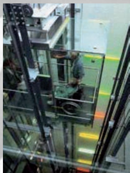
Lift Ausgang Grosse Schanze, Bahnhof Bern GWJ Architekten, Bern